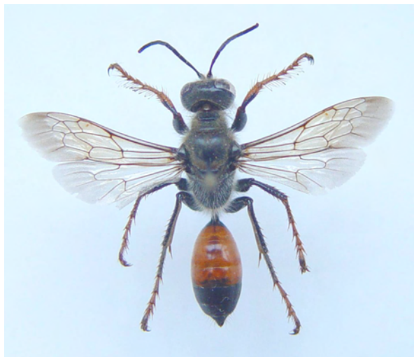
Figure 1. Femelle de Sphex funerarius GUSSAKOVSKIJ capturée à Meix-devant-Virton

Livory A, Chevin H, Lair X, Sagot P & Baldock D, 2008. Nouvelle liste commentée des Hymenoptera Sphecidae du département de la Manche. II. Ampulicinae, Sphecinae, Mellinae, Nyssoninae, Philanthinae. L'Argiope 61: 18-49.